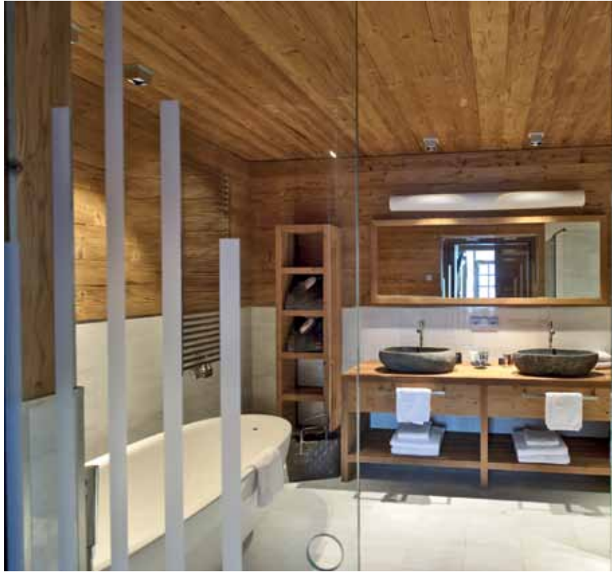
Es kamen ausschließlich natürliche, hochwertige und heimische Baustoffe, wie Laaser Marmor oder Altholz aus dem Gadertal, zum Einsatz