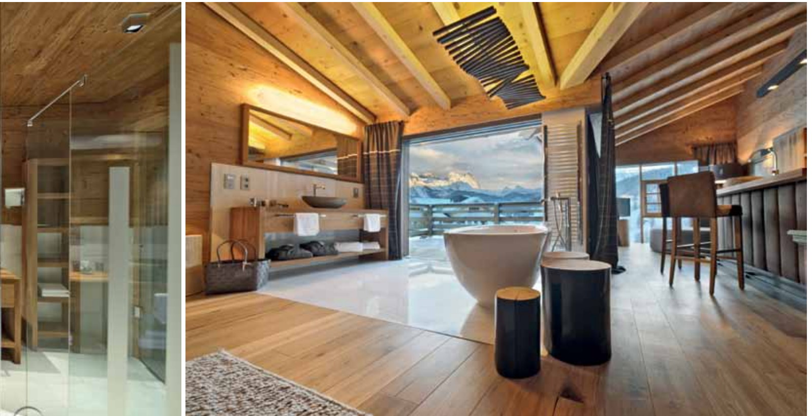
Der Begriff Luxus wird in den Chalets neu definiert