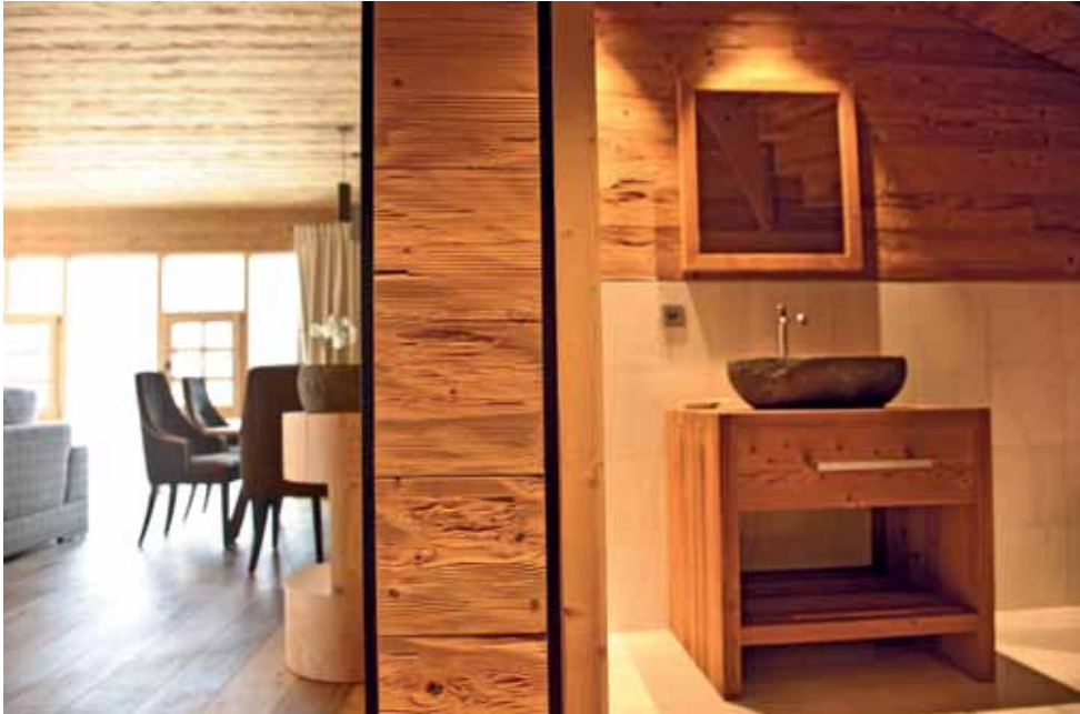
Alte Möbel treffen hier auf handgefertigte Designerobjekte